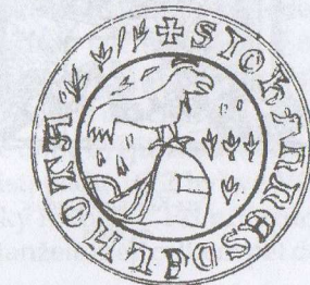
184-8 Jan ml. Podlavička z Lhoty, 1378 Tr 619, fol. 69.