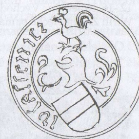
170-10 Kašpar z Vlásenice, 1483 Coll II 265, fol. 69.