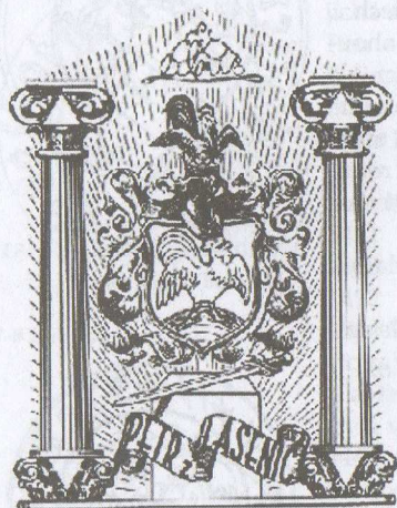
Petr Kohout - Lasenic ex libris

12.-16. století; in.: Východočeský sborník Historický, 1, 1991, str. 49 - 104. 16. Wirth Z., Umělecké památky Čech 1957, str. 640.