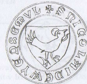
88-3 Mikuláš Podlavička z Vícemile, 1382 Gub I 61, fol. 70.