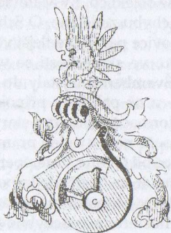
Erb Lehomských z Malevic