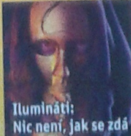
Ilumináti: Nic není, jak se zdá