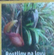
Rostliny na lovu