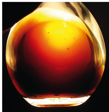
Spagyrická esence Meduňky