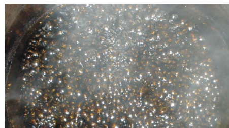
Očista alchymistické síry