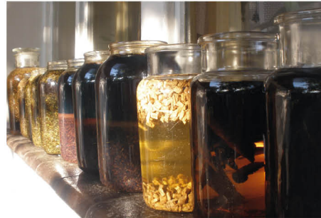
Nakládání bylin na tinktury