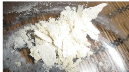
Alchymistický princip Soli