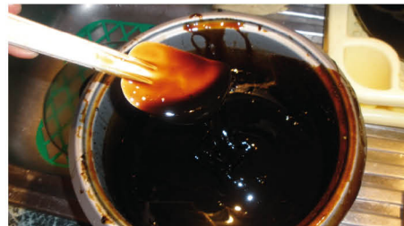
Alchymistický princip Síry