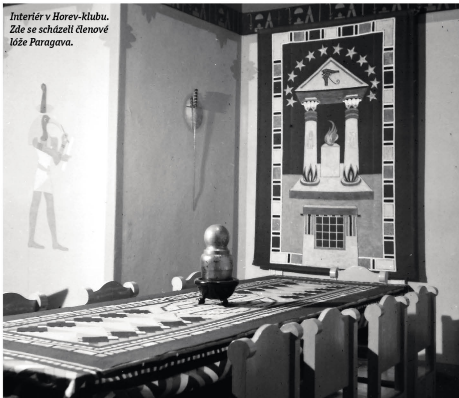
Interiér v Horev-klubu. Zde se scházeli členové lóže Paragava.