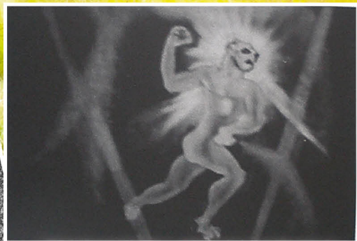
Bytosti z deníku Horev-klubu: kontrolní snímek elementála Saturnu (vlevo) a elementál Slunce (vpravo). Mezi fotografiemi jsou očividně i jasné falzifikáty.