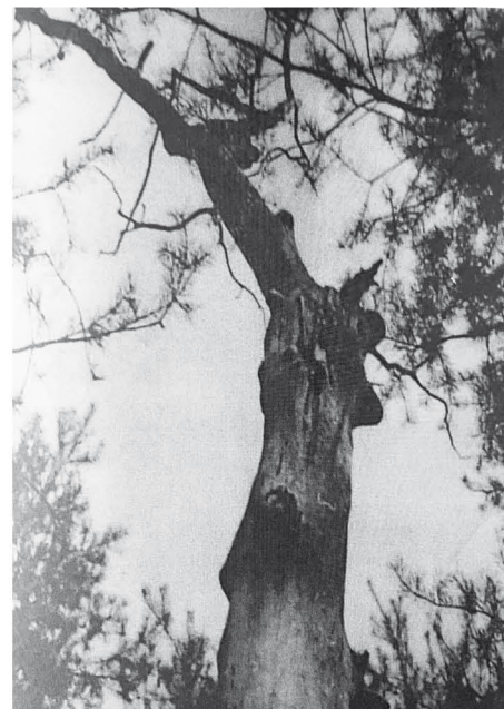
Gnómův dub v Káraném

Deník Horev-klubu se dnes nachází v soukromé sbírce člověka, který jej chrání před likvidací a nepochopením ze strany těch, kdo na »nadpřirozeno« nevěří. Přesto jsem našla na internetu wordový dokument přepisu, jenž měl údajně vzniknout v roce 2004 z fotokopie strojového textu (nikoliv však přímo z originálu). Ačkoliv je jeho pravdivost nejistá, uvedme alespoň část, která zde hovoří právě o Azielovi. „...jeden z našich bratrů přál si vyslechnouti všechny zvukové efekty, které Aziel měl čas od času dovoleno provozovati. Zůstal proto ve vile přes noc s jiným bratrem. Aziel dostal volnost projevu a přítomní zaslechli celé skupiny zvuků: zvonění v dálce, xylofonové tóny, rachot, klepání a vše se zesílilo až k řevu pouštního lva a otřásání celého domu v základech tak, že i nábytek se chvěl jako při zemětřesení. Jiný z návštěvníků viděl Aziela za denního světla v klubovně jako shluk mlhoviny temně modře až fialově zářící, který pomalu plul z jednoho konce místnosti do druhého.“