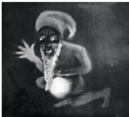
Hermetiky vyfocený gnóm

jako z revolveru. Kousky dočervena rozžhavené země vyletěly při tom kolmo do výše více než dva metry, kdež se rozštěpily v ohnivý snop. Ač jsme stáli všichni velmi blízko, nedopadly na nikoho. Pak konstatovali jsme silný zápach, jako po petroleji, kterým nám načichl všechen oděv.“ Od svého služebního ducha se posléze dozvěděli důvod: „Petrolej jest astrální vůně Petrova, tedy skalního, gnómického oleje, jenž doprovází všechny zemské živelné bytosti.“