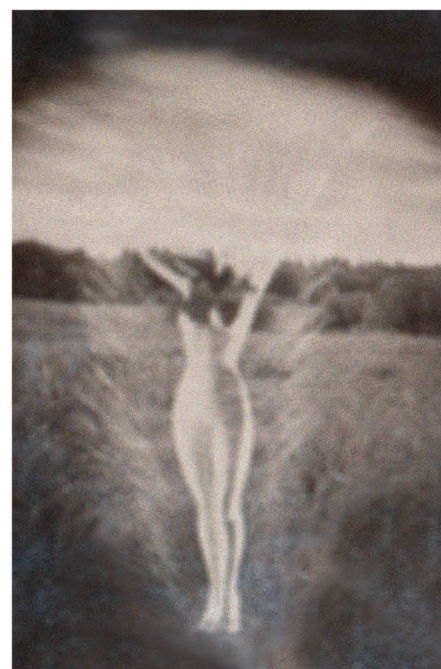
Bytost undiny z deníku Horev-klubu (také podvrh)