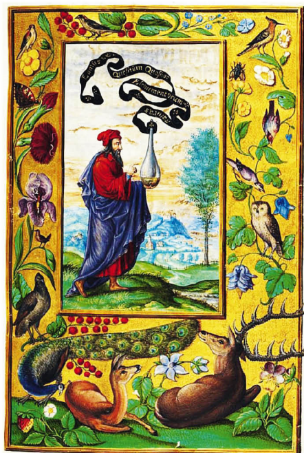
Alchymista, Splendor Solis, 1582

Ano, každý zdravý člověk má své subjektivní vnímání a učí se poznávat svět používáním svých smyslů a emocí. Jen málokdy je však ochoten si přiznat, že díky »nekalibrování těchto nástrojů« nachází jen dílčí část pravdy. Zůstává slepou, hluchou a němou opičkou, která nikdy nepozná to, co se skrývá za horizontem jejího vlastního stínu. Alchy-