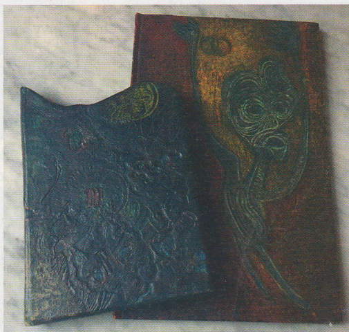
Výrobky z knihvazačské dílny zručného hermetika

Já jsem dost opatrná, a proto moje cesta ni-