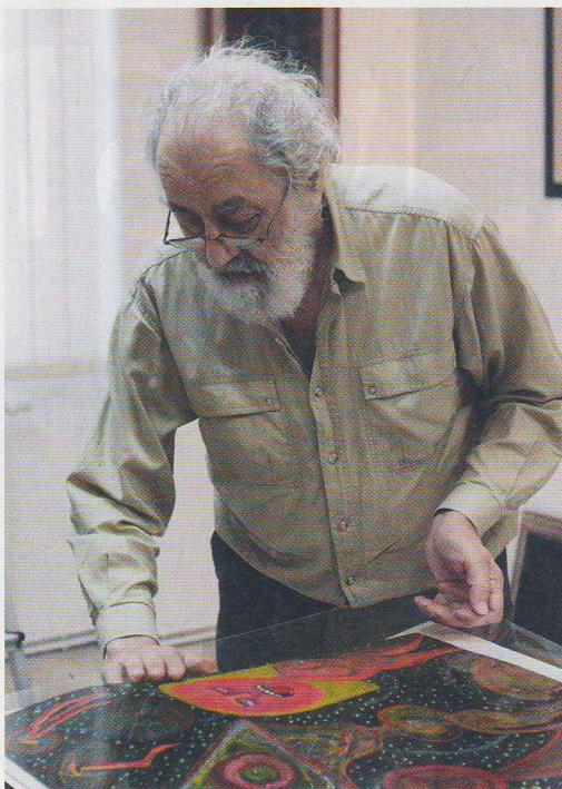
Instalace autorské výstavy v Galerii Emila Julíše v září 2009

Ze začátku vůbec, opravdu jsem se k němu dostala až někdy na vysoké škole. Jenže s tátou to bylo složité, člověk za ním nemohl přijít jen tak s přímou otázkou – málokdy na ni totiž slyšel přímou odpověď. Většinou dostal jen tajemně znějící indicii,