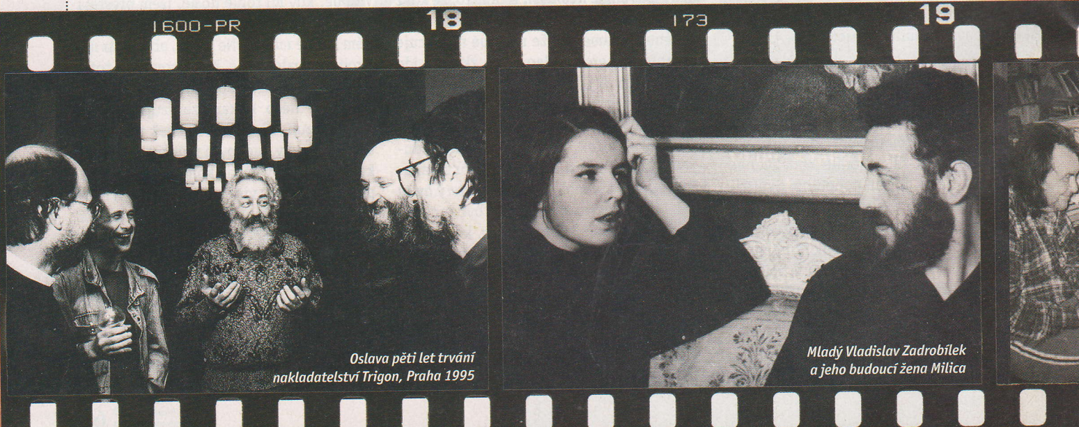
Oslava pěti let trvání nakladatelství Trigon, Praha 1995

jste ještě před několika lety při troše štěstí mohli někde potkat, jsme odstartovali v září tohoto roku. A pokud jste našimi pravidelnými čtenáři, dozvěděli jste se už o něm mnoho zajímavostí z úst těch, kdo k němu osobně i k jeho nestárnoucímu knižnímu odkazu chovali obrovskou úctu. Dnes, v závěrečné části seriálu, vyslechneme-